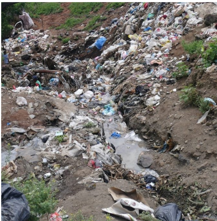
En février dernier, les déchets sur les pentes des hauteurs de Majicavo Dubaï

postage... de nouveaux comportements s'ancrent. Certains déchets (piles, ampoules), ayant fait l'objet de larges campagnes de communication, sont plus volontiers triés.